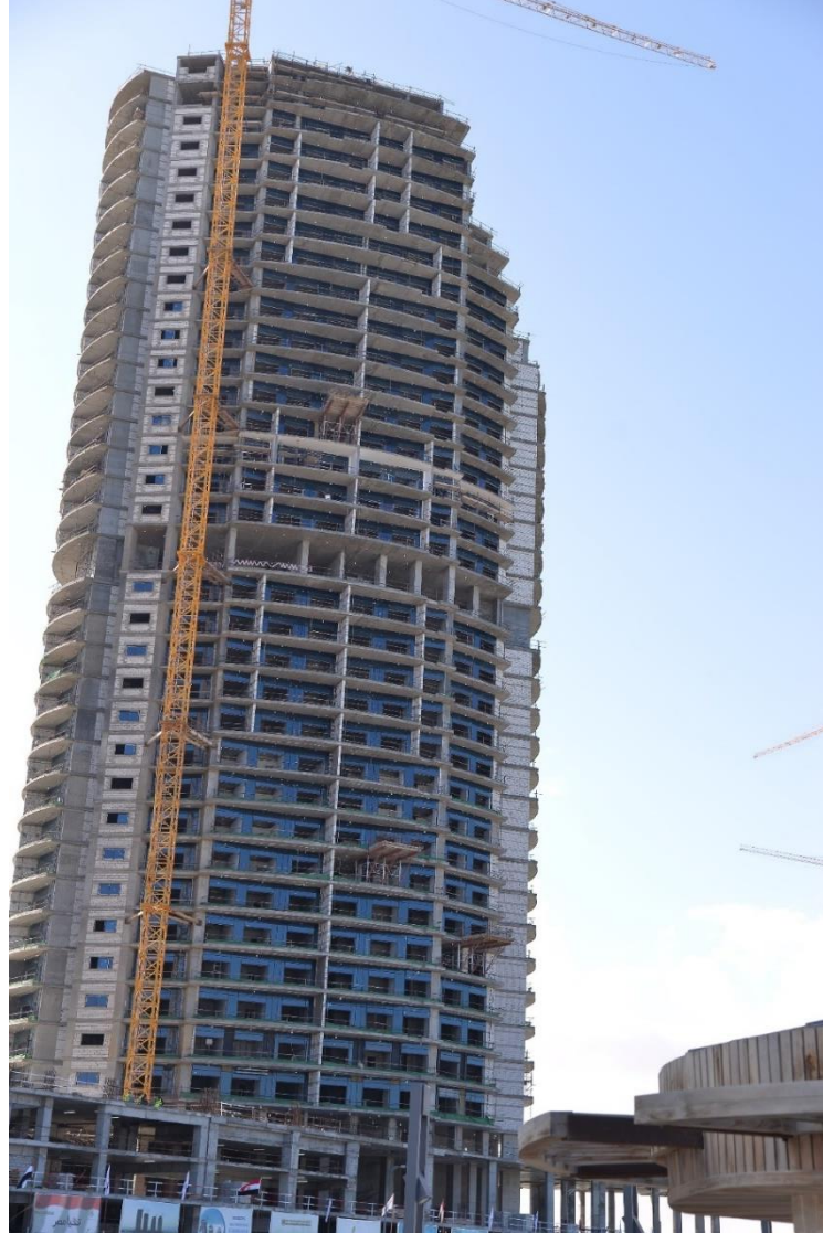
أعمال البرج C2