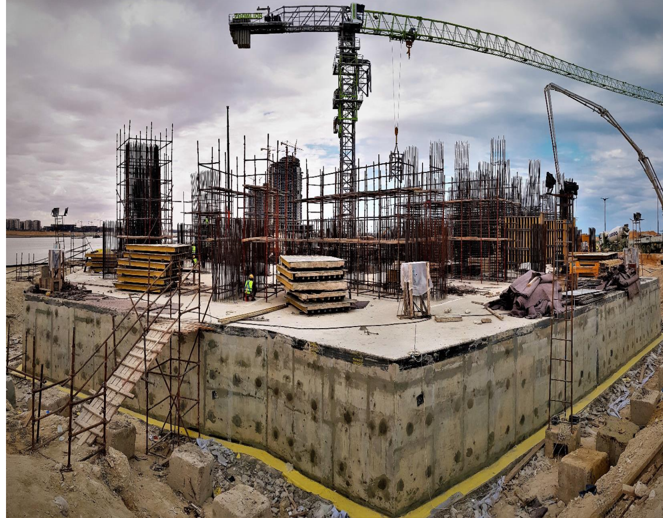
جارى اعمال حداده الكور برج A