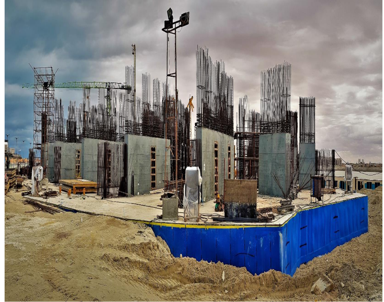
تم صب الاكوار للدور الارضى برج C