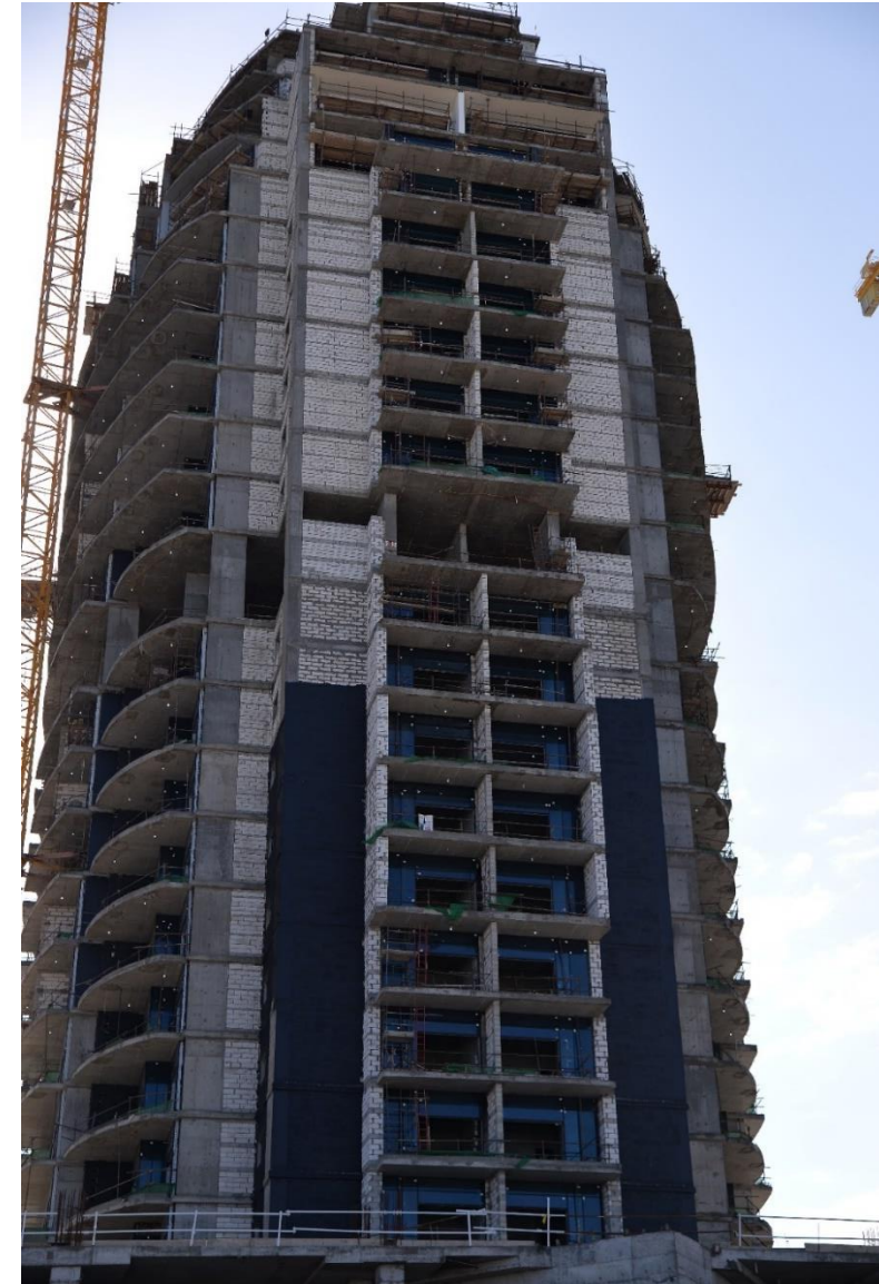
اعمال البرج ( C3 )