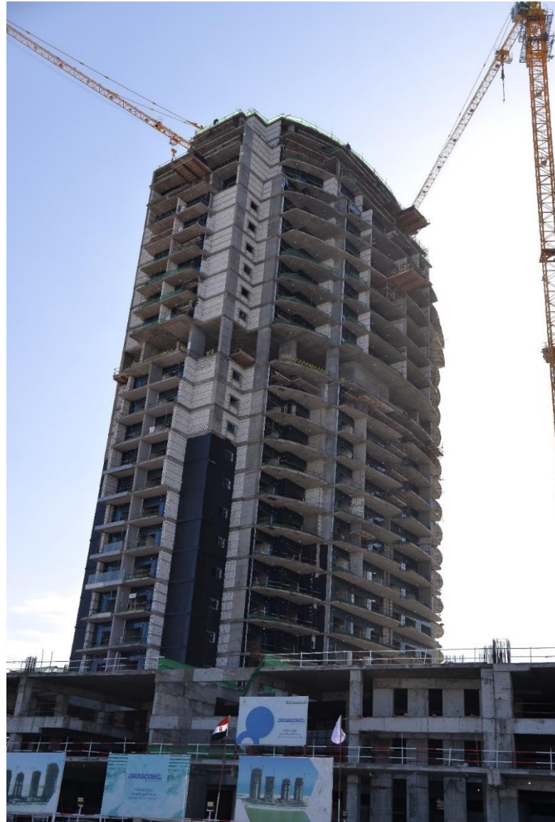
اعمال البرج ( C4 )