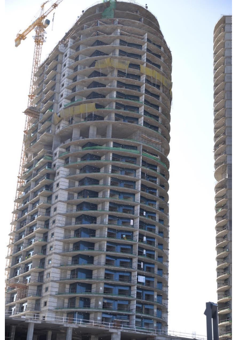
أعمال البرج C1