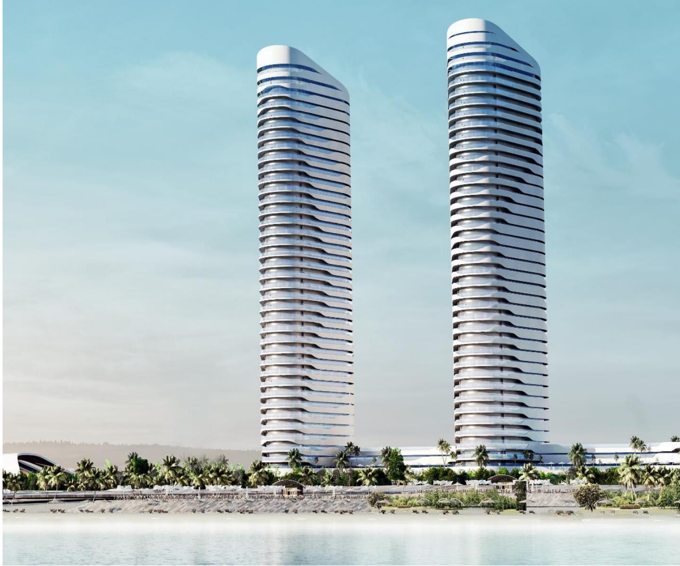
التصميم المعماري المقترح للأبراج