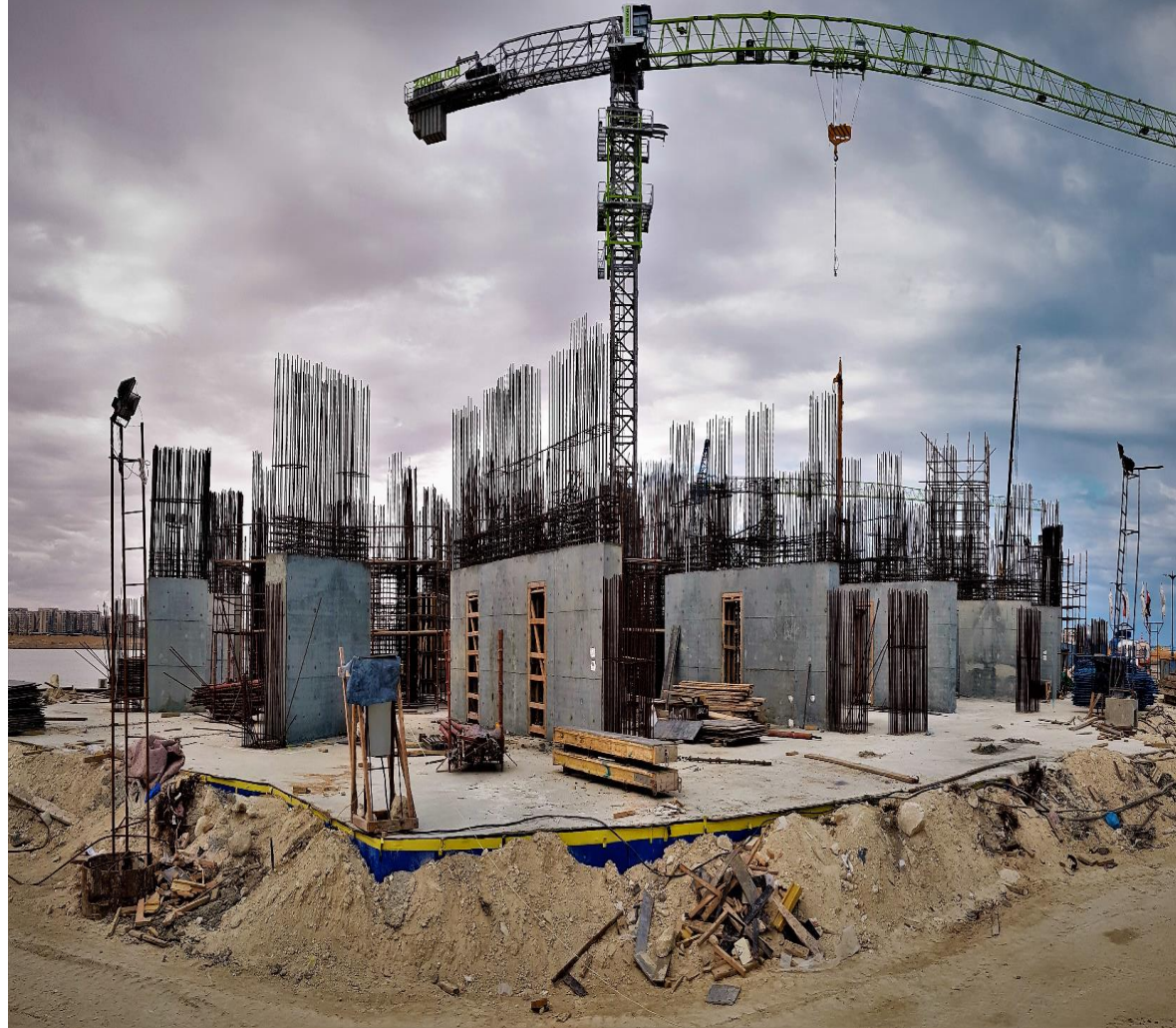
تم صب الاكوار للدور الارضى برج B