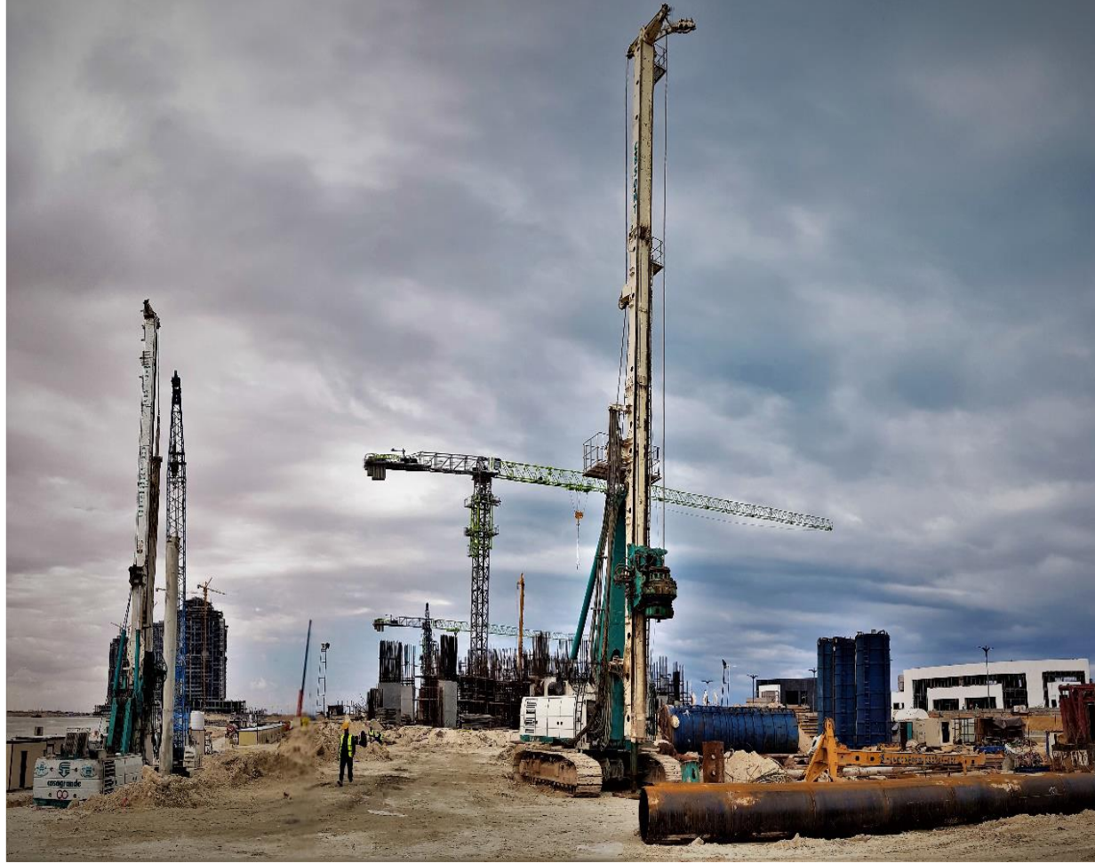
جارى أعمال الخوازيق للبوديوم